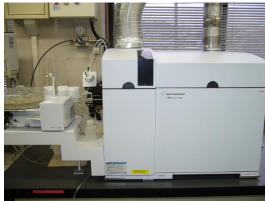
金属類の測定に使用する誘導結合プラズマ質量分析装置