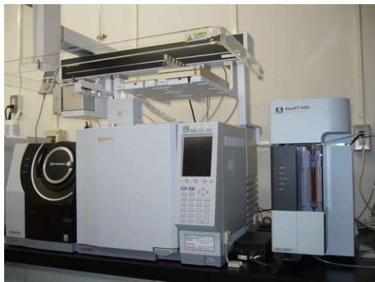
かび臭物質の測定に使用するガスクロマトグラフィー質量分析装置

外部検査機関へ委託する項目については、検査結果の根拠となる資料（写真、検量線、クロマトグラム等）を確認するとともに、年1回以上委託検査機関に立ち入り検査を行い、実施状況を確認します。