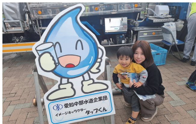
▲本企业団イメージキャラクター「タップくん」と記念撮影！