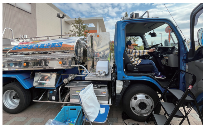
▲給水車乗車体験の様子