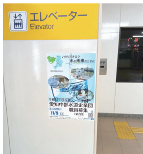
▲日進駅掲示例（令和7年10月）